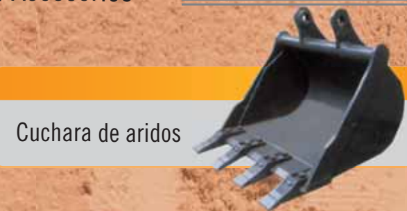
Cuchara de aridos