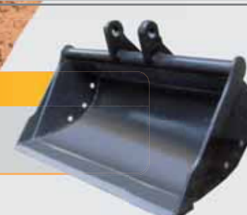
Cuchara de limpieza canales