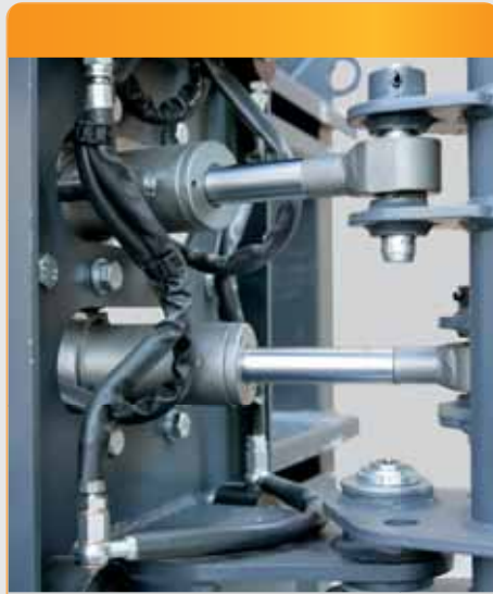
Doble cilindros de rotación con limitador de fin de carrera.