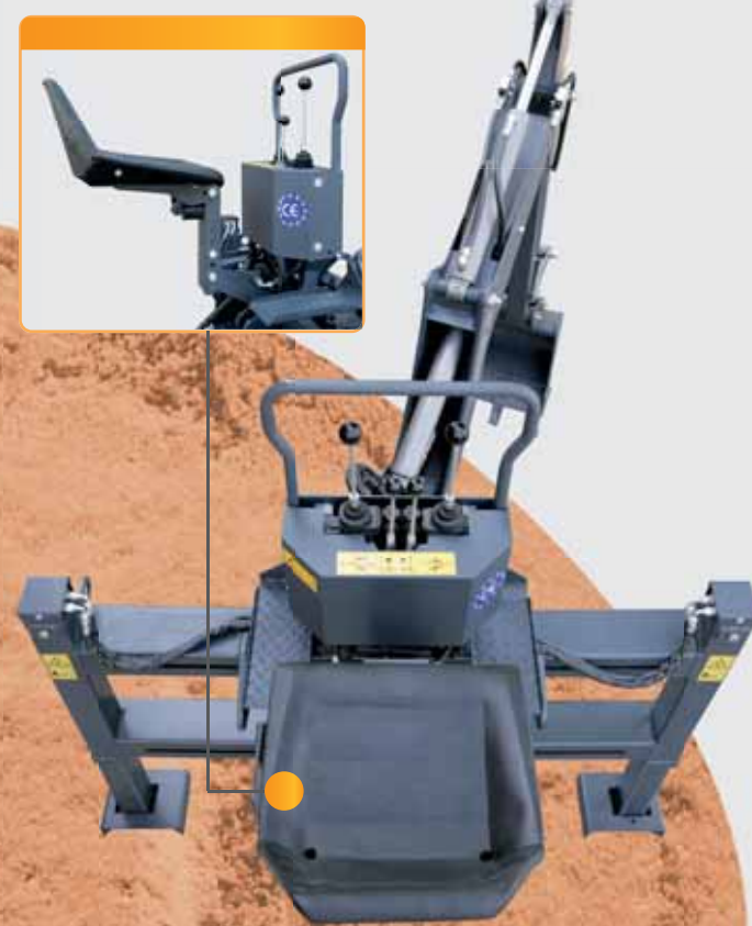
Un asiento ergonómico, bien accesible y ajustable, permite una buena visibilidad para el operador y garantiza un trabajo cómodo y en seguridad.