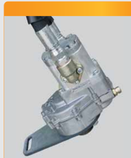
Bomba hidráulica con cuerpo en fundición para gran rendimiento.